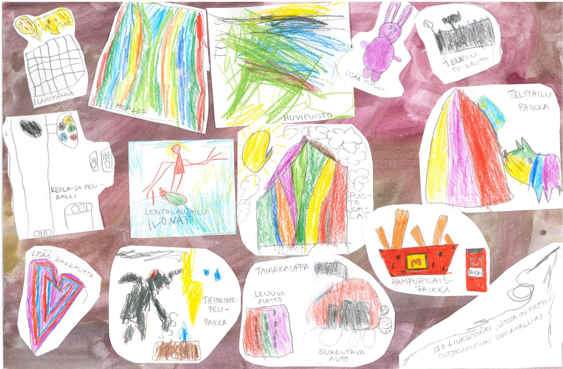
Kuva: Varhaiskasvatuksen Kulkurit-ryhmän lasten toiveita ja ideoita unelmien Outokumpuun. Tulevaisuus tehdään yhdessä!